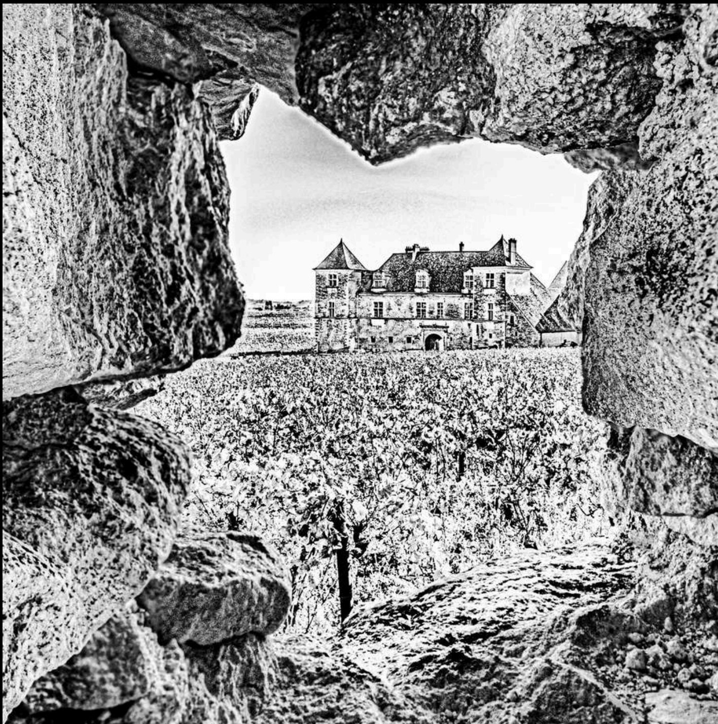
Pierre feuille château, 2024

Le célèbre et prestigieux château du Clos Vougeot en Côte d'Or est un sujet rêvé à photo croquer. La fameuse vue à travers le trou du mur d'enceinte prend une tout autre dimension sous les traits de mon objectif, une composition qu'i m'a très rapidement inspiré le titre.