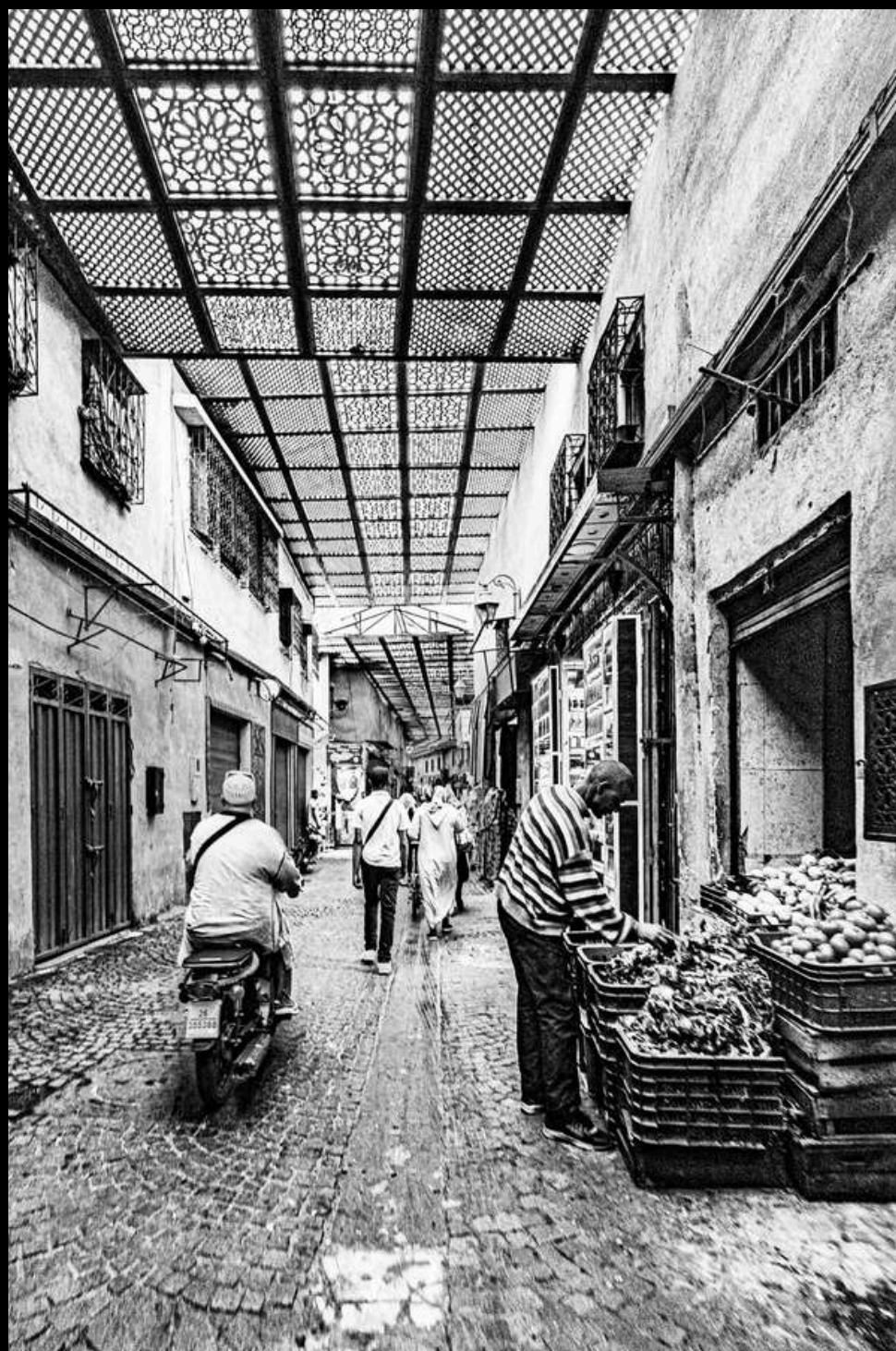
C'est le souk, 2025

Les grands et beaux voyages, on les rêve, les planifie, les réalise, les revit à travers les souvenirs. Avec mon travail d'artiste photographe, je les immortalise, les concrétise et les interprète pour mieux sublimer et partager. Plongez avec moi au coeur du souk de Marrakech et sentez ces bonnes odeurs !