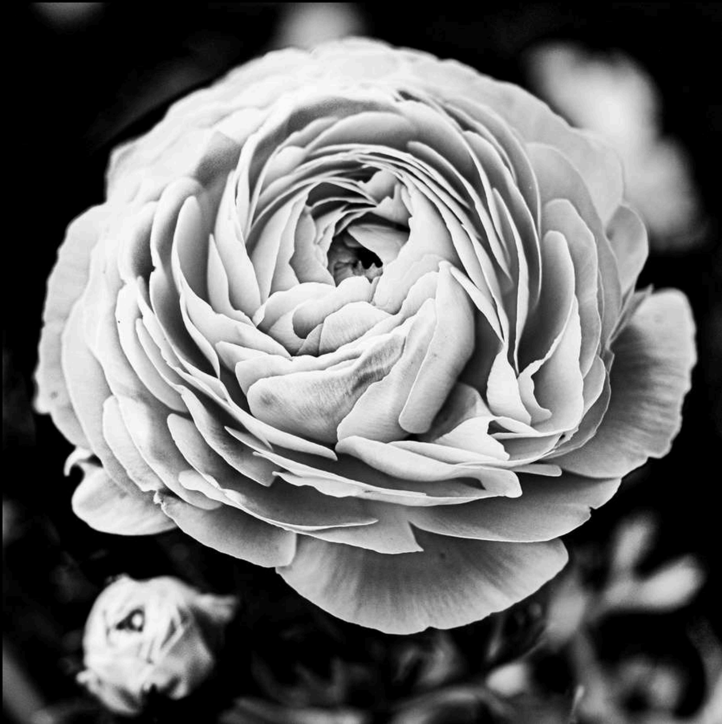
Un œil dans le cœur, 2024