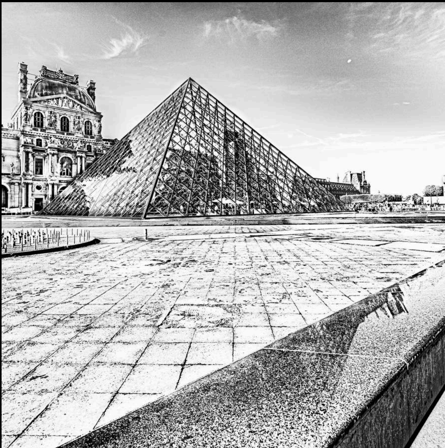
Reflet suggéré, 2024

Pas facile d'être original face à un lieu pris en photo des milliers de fois chaque jour. Pourtant ce matin-là quand je suis passé ce cadre m'a immédiatement happé et inspiré. Pour la petite histoire, ce matin-là je suis en route pour l'aéroport pour mon voyage en Irlande, celui qui donnera naissance à Moher experience.