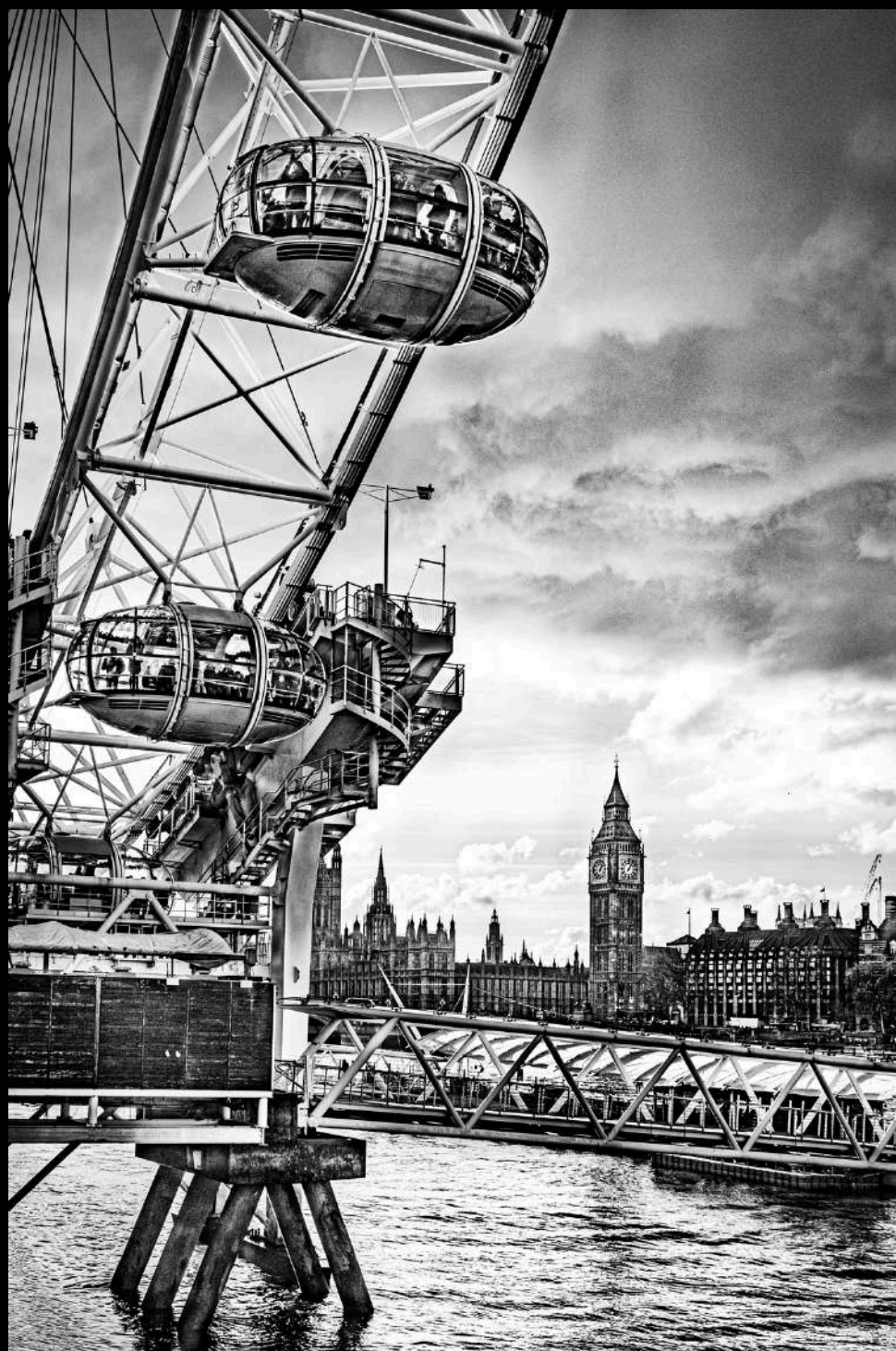
Dialogues d'acier et de pierre - 2026

Tout l'esprit de Londres résumé en un seul regard. J'ai voulu capturer la rencontre directe entre les lignes futuristes du London Eye et la silhouette immuable de Big Ben. Mais surtout partager la vision que j'ai eu dans la file d'attente pour monter sur le London Eye. Le traitement en noir et blanc souligne la complexité métallique de la roue au premier plan, tout en transformant le Palais de Westminster, Big Ben et la Tamise en une véritable gravure historique. C'est ce dialogue entre deux époques, entre le mouvement et l'éternité, qui donne à cette perspective et à Londres toute sa puissance, figé comme une esquisse au fusain.