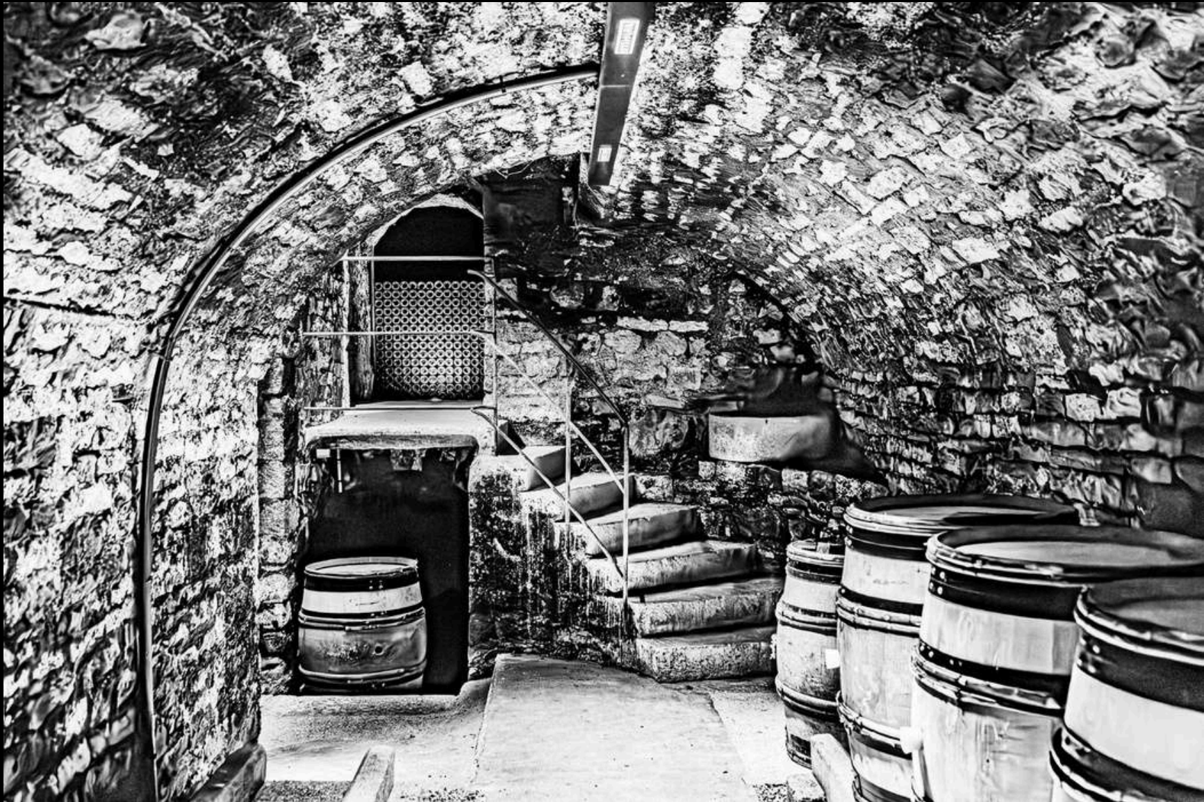
Cave Œno Croquée, 2024

Photo emblématique de ma série des “Œno Croquées”, j’y exprime pleinement ma vision de l’ambiance d’une cave à vins. Comme très souvent j’ai immédiatement été inspiré par ce cadre qui c’est imposé de lui même tant la magie opère.