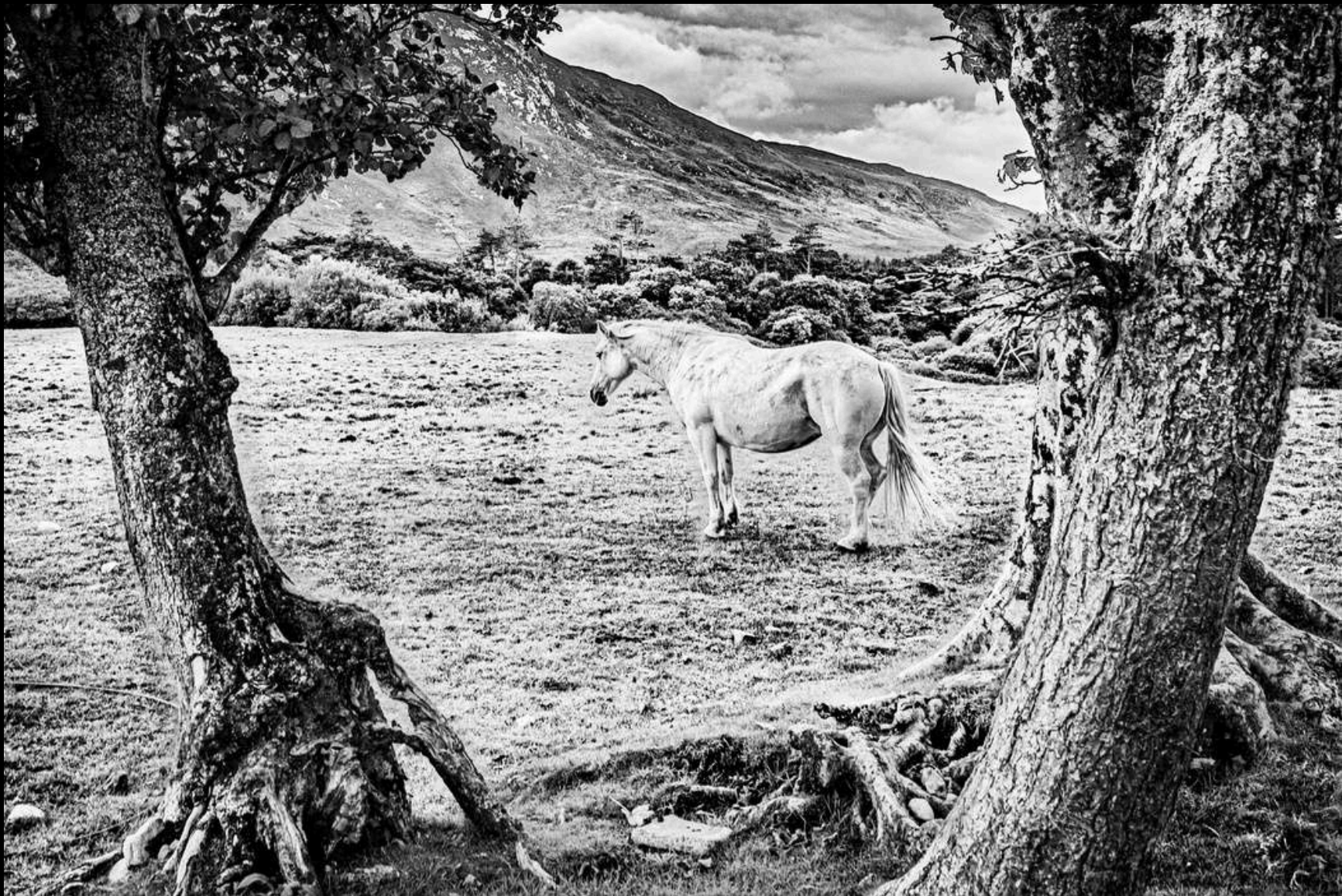
Tranquilité équine, 2024

La faune et la flore sont des sujets, naturels, qui me touchent autant que des lieux magnifiquement créés par l'homme. Dans les deux cas ce sont les détails mis en avant par mon travail qui viennent illustrer et faire passer les émotions qu'ils m'ont offert au moment où j'ai vécu la scène. Ressentez-vous comme moi cet extraordinaire sentiment d'apaisement qui se dégage ?