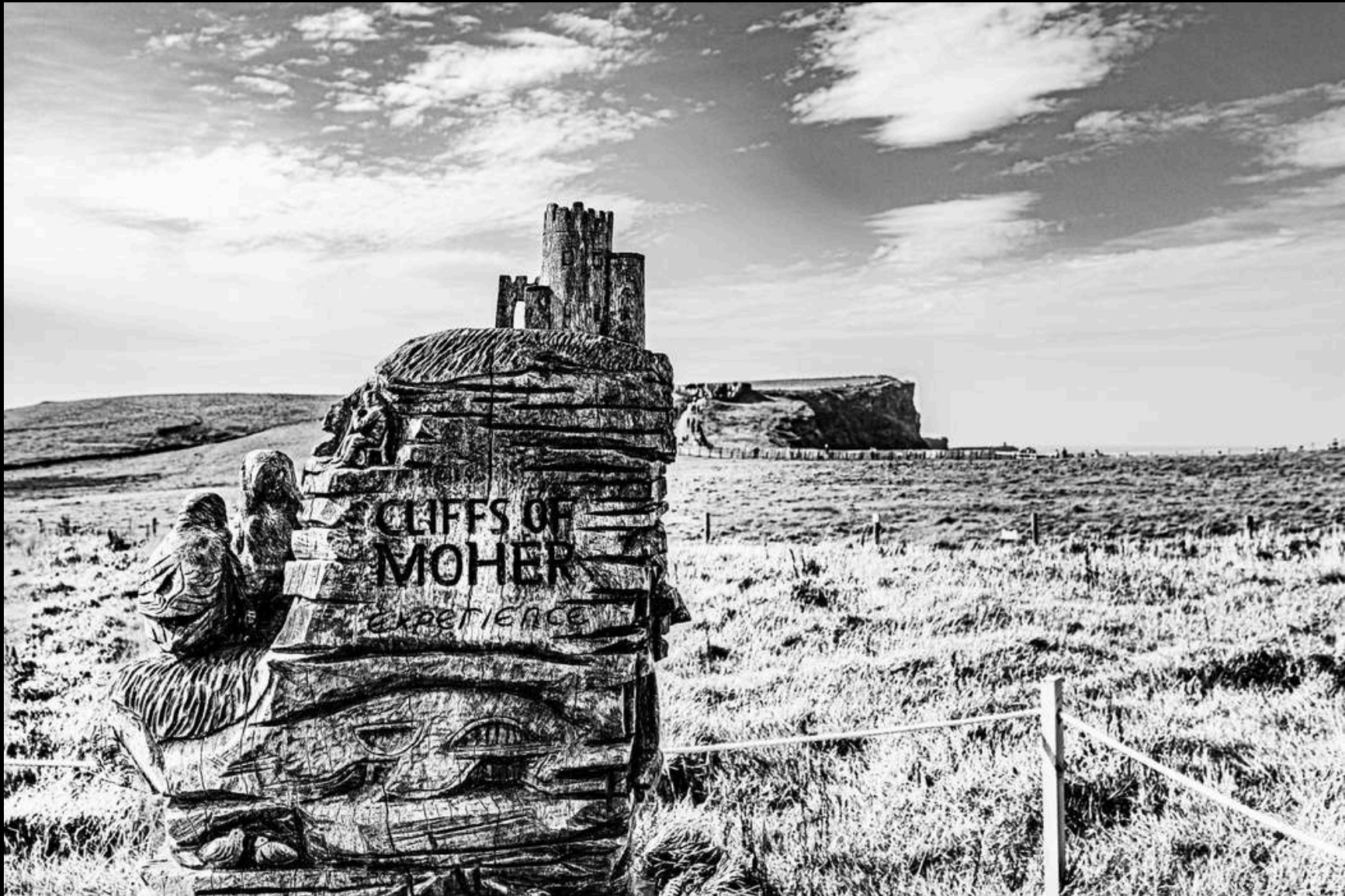
Moher experience, 2025

Les grands et beaux voyages, on les rêve, les planifie, les réalise, les revit à travers les souvenirs. Avec mon travail d'artiste photographe, je les immortalise, les concrétise et les interprète pour mieux sublimer et partager. Tout le monde devrait visiter le célèbre site irlandais des falaises de Moher, qui a arraché une larme d'émotion à mon épouse.