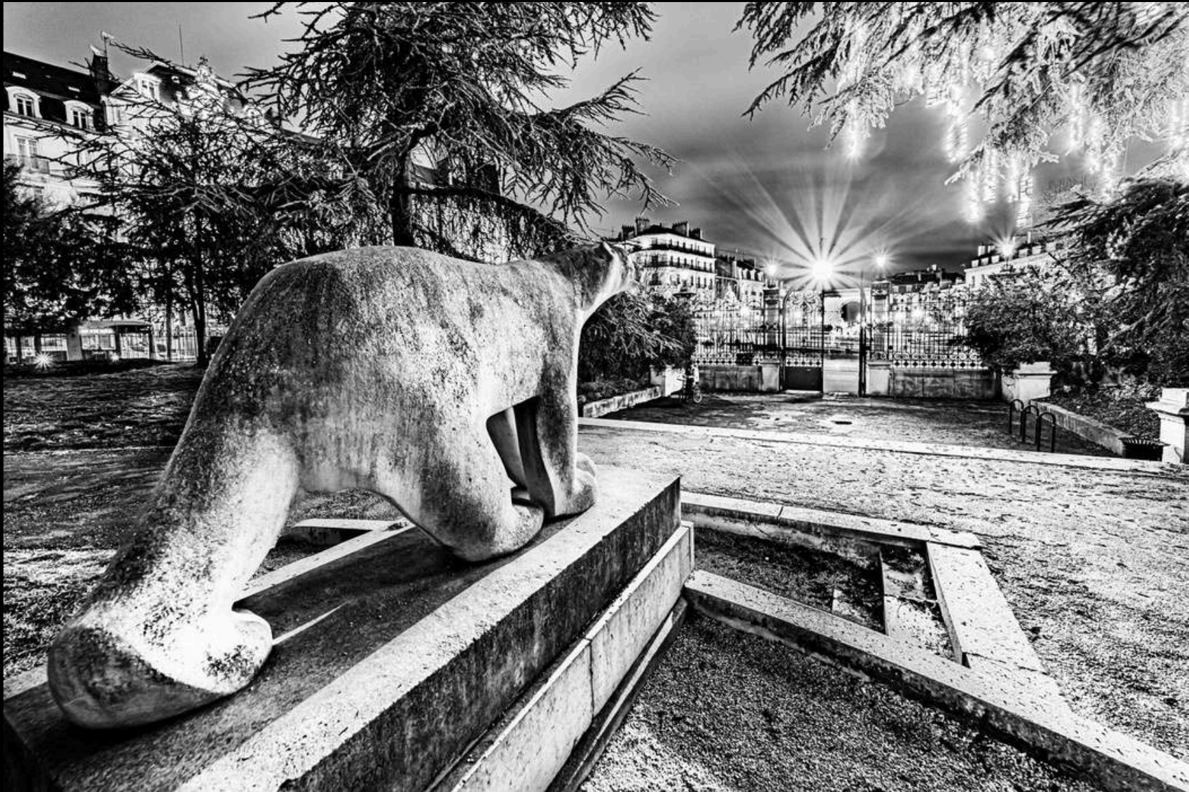
Pompon dans les starting blocks, 2023

L'idée de cette composition est de donner une dynamique importante à l'image fixe en jouant avec la forme de Pompon et l'angle de vue. Ainsi il se transforme en sprinteur prêt à bondir et s'échapper dans la ville pendant qu'en arrière plan le passage du tram achève d'animer la photo. Proposée par l'éditeur d'art Artemus Edition.