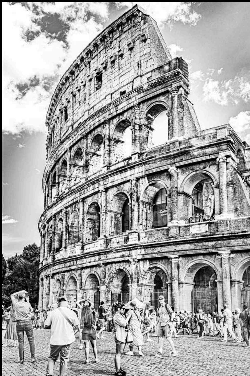
Colisée profilé, 2024

Les grands et beaux voyages, on les rêve, les planifie, les réalise, les revit à travers les souvenirs. Avec mon travail d'artiste photographe, je les immortalise, les concrétise et les interprète pour mieux sublimer et partager. Grandeur et admiration, ressentez