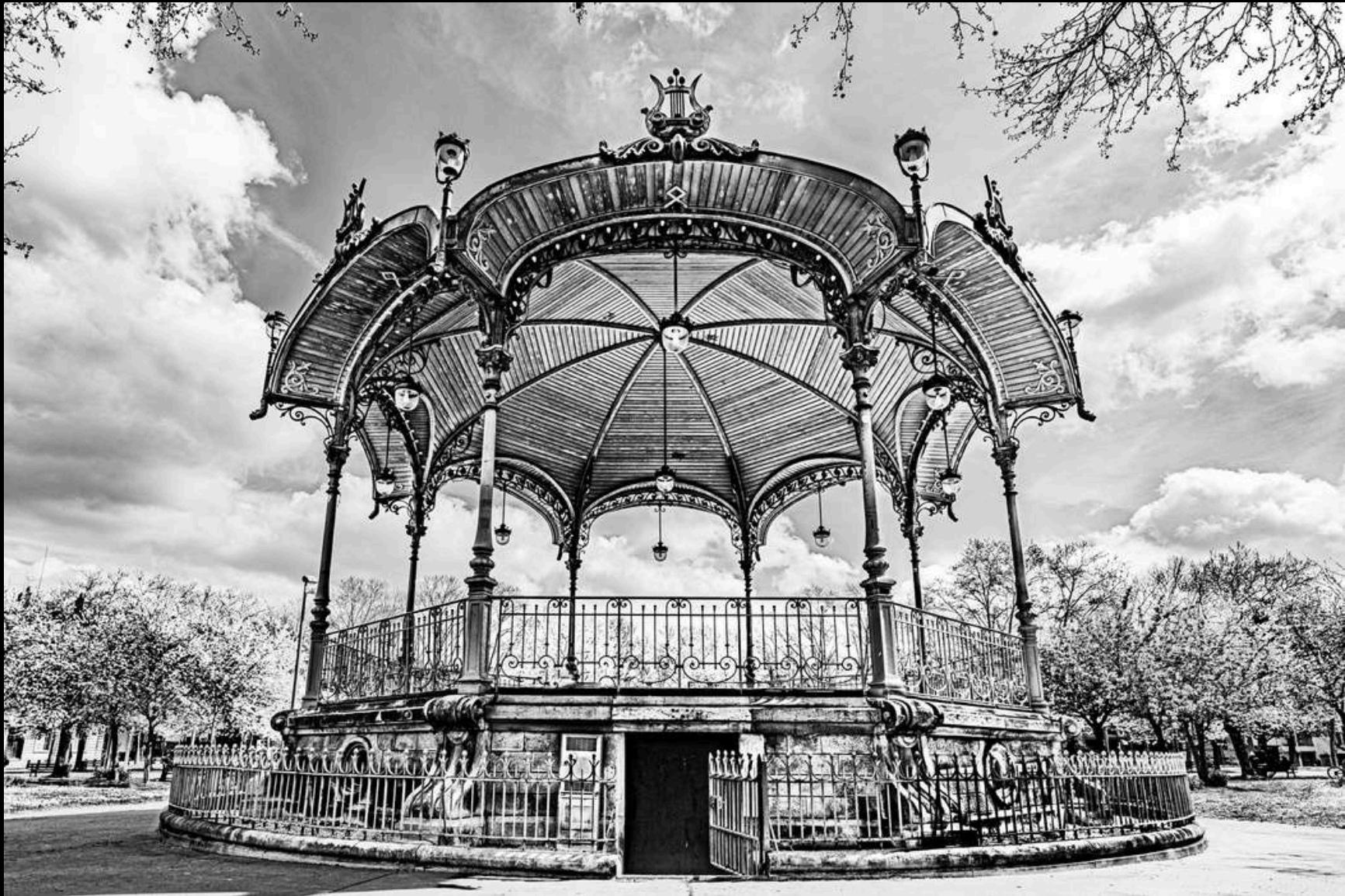
Le kiosque Wilson, 2024

La magie de la photo croquée est de mettre en lumière la beauté des détails qui sont moins visibles sur place. Le kiosque Wilson est le parfait exemple avec ce travail de lumière que j'ai réalisé sur le dessous de la coupole pour les mettre en avant, alors qu'en réalité il sont toujours plus ou moins dans l'ombre.